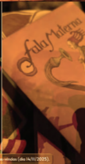
O libreto, em gesto de boas-vindas (dia 14/11/2025).